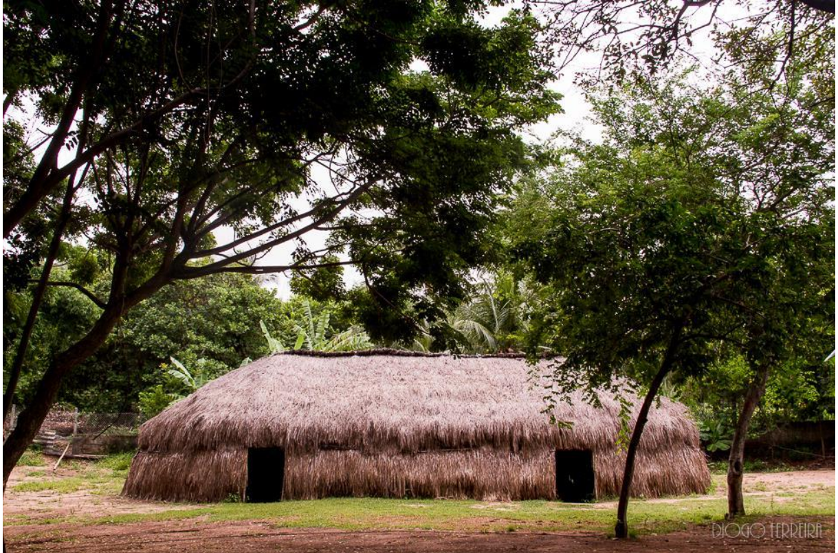
Imagem 2. Oca central do sítio

O conhecimento adquirido com os indígenas paraibanos, aliado aos estudos em permacultura 12 , possibilitou a construção biodegradável das ocas (cf. Imagem 2), cobertas com Capim Manibu, popularmente conhecido como Capim Navalha, abundante na região.