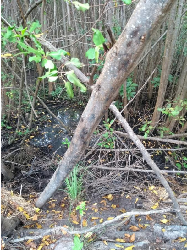
Imagem 3. Área de mangue

Outro embargo percebido foi a ausência da intervenção do poder público, proposital haja vista que o Gamboa é um espaço de resistência (ambiental, política, cultural...). Este distanciamento vai ao encontro das afirmações que os entrevistados fizeram acerca da estratégia de dominação, na qual governo enfatiza a ascendência africana com o intuito de fazer a população esquecer-se da sua outra herança cultural: a indígena, reprimida com o intuito de que sua invisibilidade contribua para a conquista de seus territórios.