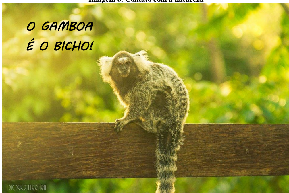
Imagem 6. Contato com a natureza

Além de todos os equipamentos e atividades, o discurso de venda é muito baseado na experiência (cf. Imagem 6). A dormida indígena, o alimento servido nas quengas de coco, a água na moringa, o contato com a natureza desde o ar puro até a contemplação de plantas e animais. Aprender a usar um arco e flecha, jogar peteca, o contato com a língua Tupi. Tomar banho no rio, ouvir o canto dos pássaros. De acordo com Abà essas são sensações que não têm preço.