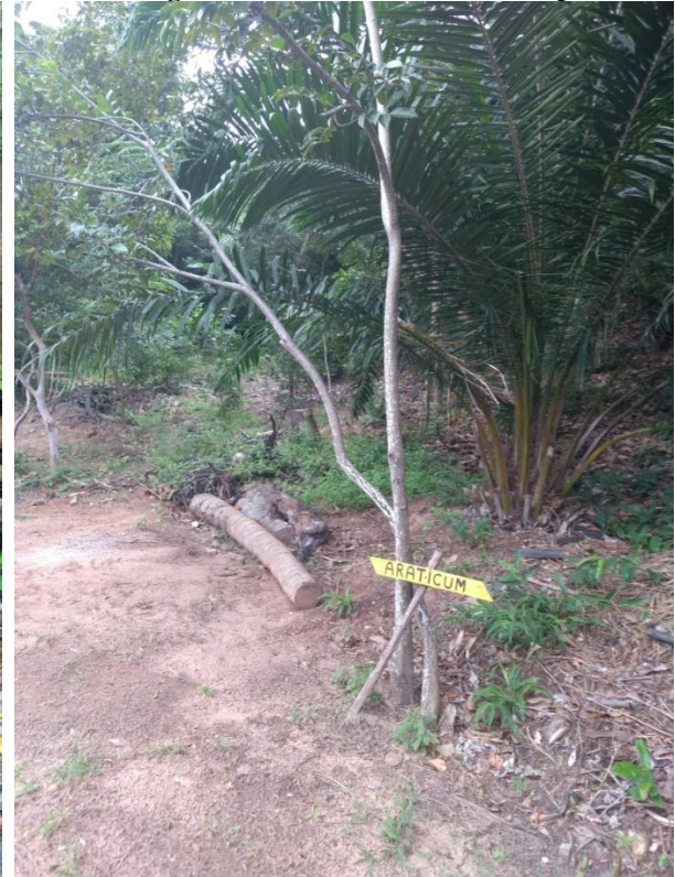
Imagem 4. Trilha sinalizada em Tupi