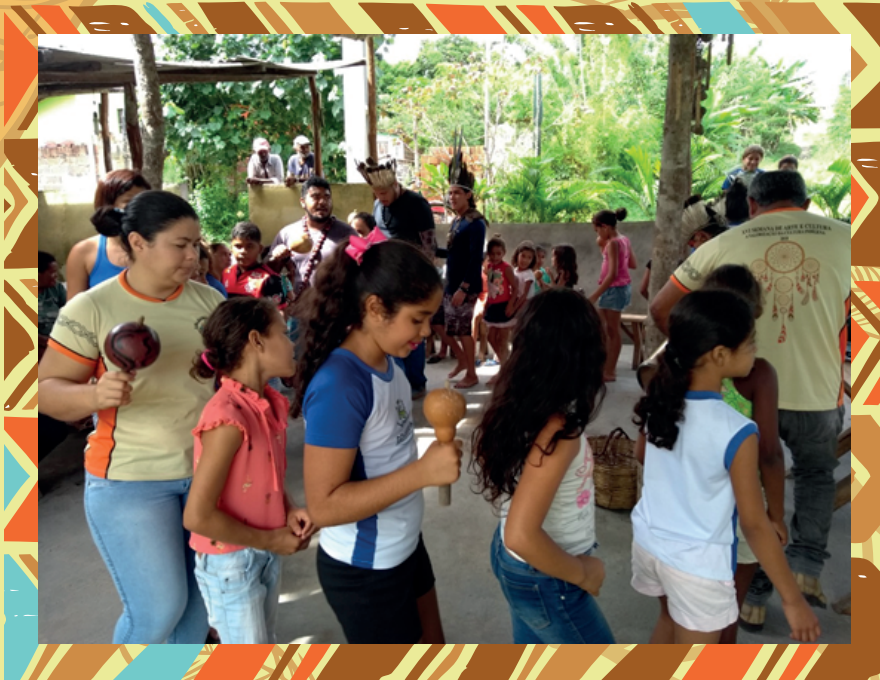
Foto: Taisa Lewitzki/Acervo FUNAI, Comunidade Eleotérios do Catu (Canguaretama/Goianinha)

A Política Nacional de Desenvolvimento Sustentável dos Povos e Comunidades Tradicionais, instituída pelo Decreto nº 6040/2007, define que: